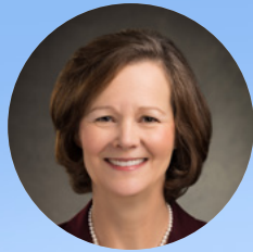
ដោយប្រធាន ស៊ីសាន អេច ផតដី ប្រធានអង្គការបឋមសិក្សាទូទៅ